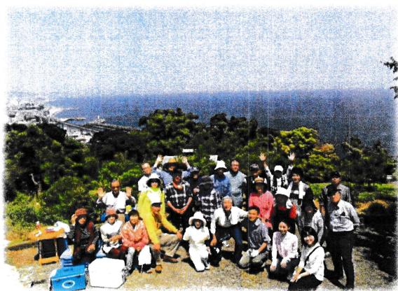
相模湾を臨む小田原市早川地区のミカン畑再生に取り組む「シニアネットワークおだわら&あしがら」のみなさんと二宮ゼミ生