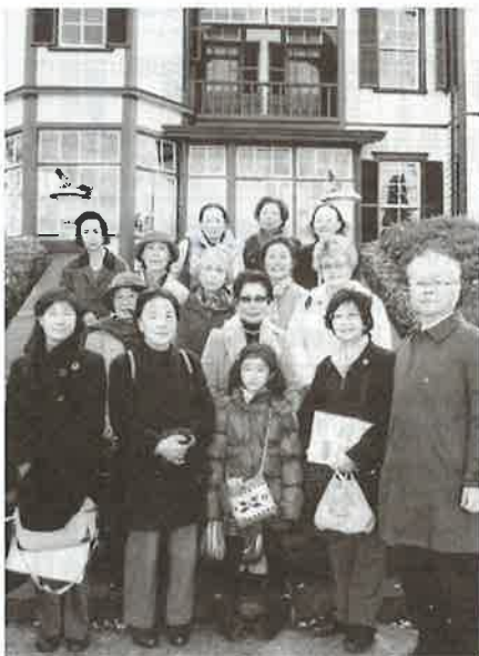
(外交官の家の前にて)

クリスマスシーズンの山手西洋館散策ガイドをお手伝いするようになって今年で四回目になるうとしていきます。歴史的建造物である七つの館は毎年世界各国のクリスマスデコレーションを見せてくれます。初回るとき、各国出身の人たちのボランティアによるものとばかり思い込んでいました。各館ごとに異なるデザインナーたちが指名されて関わっていることを知り少々失望しました。しかし、プロによる素晴らしい作品は、人々を十二分に楽しませてくれます。今までは外交官の家が最後で五時頃となり、暗くなった庭園にイルミネーションが美しい見ものでしたが、スタート時間が早まると見られなくなるのは残念です。昨年は、西洋館以外にオプション