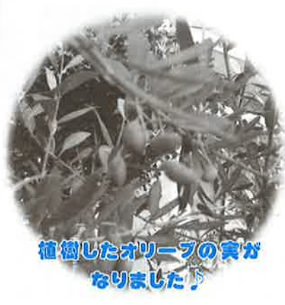
植樹したオリーブの実がなりました♪

日本には「がんばる」という言葉があり、日本人のDNAに組み込まれているように思います。でもその言葉は無責任に誰かに言うのではなく、自分の心に、自分のDNAに呼びかける言葉であると強く感じています。日本人であることを誇りに思いつつ、今も深い悲しみの中にいらっしやる皆様に、心からの哀悼を捧げます。