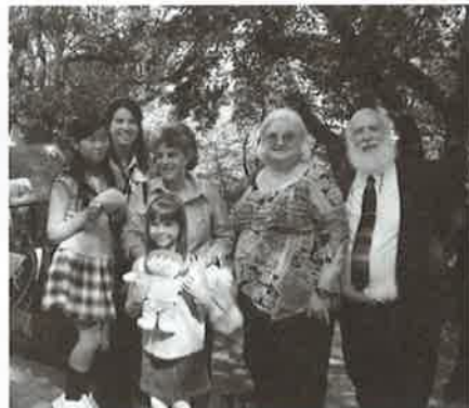
↑ ベンネット・テンネー両ファミリー