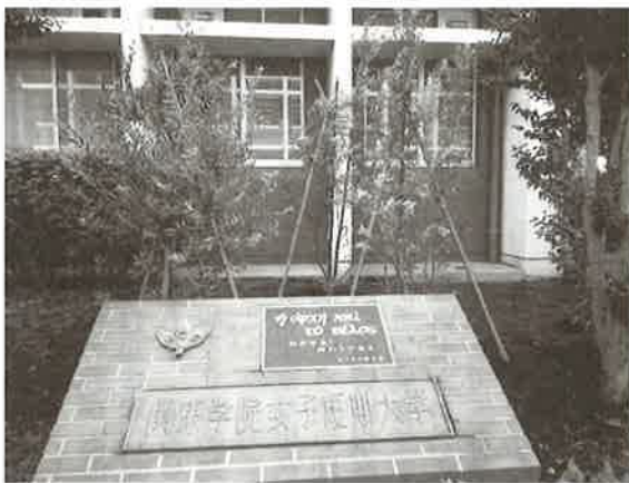
▶故下田先生からいただいた寄付で短大の碑の後ろに、オリーブの木を植樹いたしました。(室の木校地図書館棟横に碑があります)

も多くございましたが、今回は何かに促されて、参加させていただきました。その中で、先生の残されたお言葉に、「教会には、礼拝に出ることです。他に何かありますか」。今まで考え、迷っていたことが、遠くに去ってゆきました。教会に何を求めていたのでしょうか。それより礼拝に出ることを大切に。私の行く教会の牧師にそのことをお話しいたしました。「そうです、それが一番大切なことです。」と即答なさいました。母校のチャペルに先生が導いて下さったのです。感謝の記念礼拝でございます。