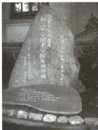
↓ 横浜バプテスト神学校発祥の地